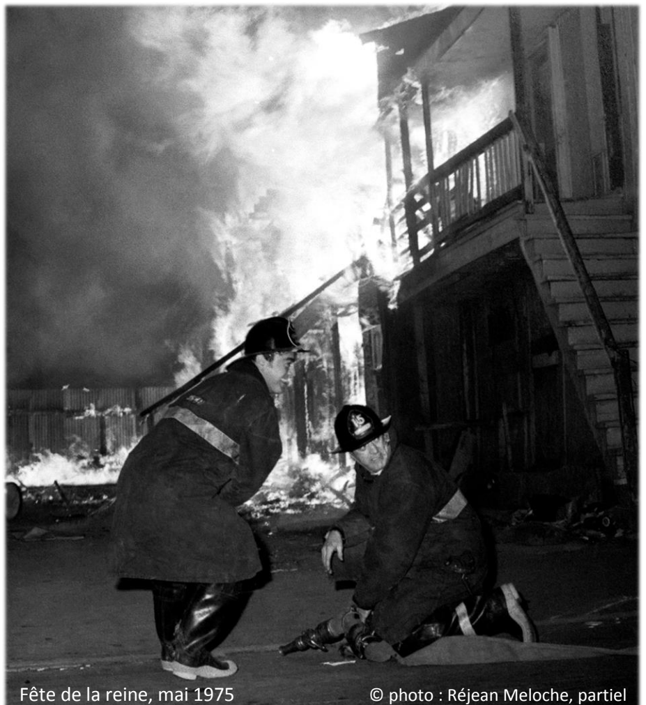
Fête de la reine, mai 1975